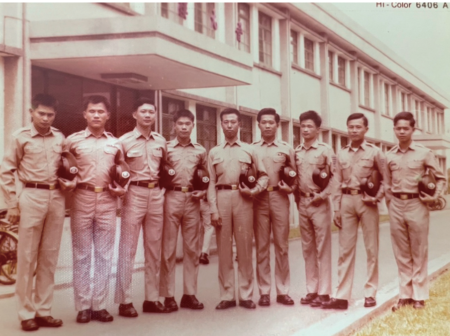
官校時期和裝甲兵同學在校園合照

多次受到上帝的指引，因而深信不疑，並大力推廣。但都是在家自行讀經、祈禱，並沒有加入教會的活動。