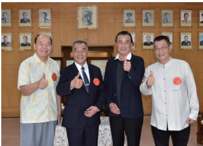
擔任校友基金會董事長，返官校參訪

從今爾後不論44期同學抑或甲兵同學的聚會，我都會積極參加。終究你我更將是白髮蒼蒼、齒牙動搖、或是健康情況江河日下，每一次聚首更彌足珍貴。永恆不變的是我們曾經在黃埔大家庭共同擁有的喜怒和哀樂，謹虔祝大夥幸福圓滿、歡樂和無憾。