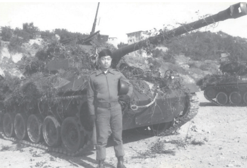
英俊挺拔的裝甲騎兵連連長：馬祖北竿

1975年畢業抽籤分配到步兵284師裝甲騎兵連，駐地在馬祖，是極少數能有機會在馬祖葛爾小島上，開著戰車橫衝直撞的裝甲人。兩年