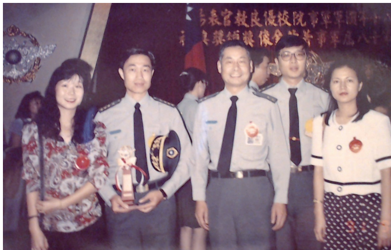
1991年榮獲國軍軍事著作金像獎人事類銅像獎

理系主任職位上退伍，轉到民間大學任教。先應學術界先進邀請，到位於桃園的元智工學院待了一年，後因交通距離因素轉回台北的世新大