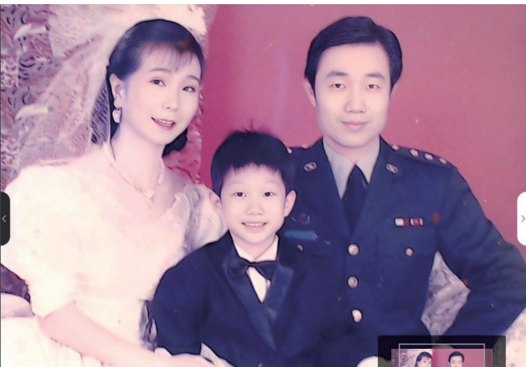
1991年：結婚十周年全家福

理系主任職位上退伍，轉到民間大學任教。先應學術界先進邀請，到位於桃園的元智工學院待了一年，後因交通距離因素轉回台北的世新大