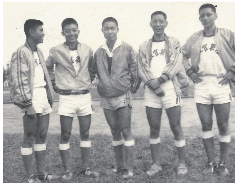
陸軍官校預備班十三期足球五虎將

教學生涯中，經由多年的努力在企業資源規劃（ERP）這個領域內建立了專業聲譽，在國內學術界和實務界都有一定的地位。2000年創立了世新大學ERP實驗室，積極參與國內多個主流學術專業社群，扮演推手角色。希望能藉由對資訊科技的應用，協助企業提升競爭力，為國家的經濟發展提供貢獻。