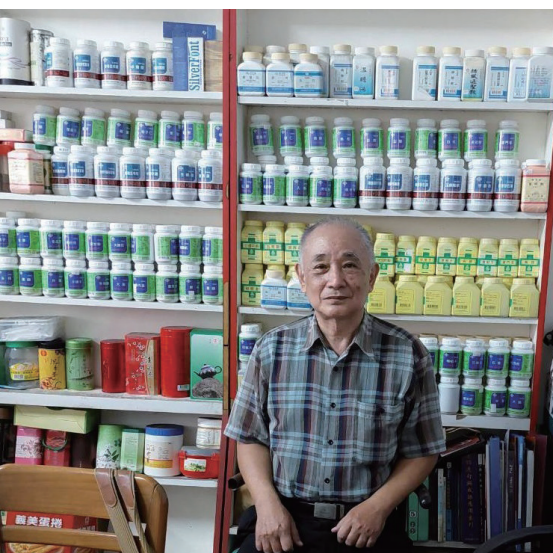
自學妙手玄醫為人強身解痛

之後在1984年3月調任機械化109師參三科任戰車參謀官，12月調任第一戰鬥群參謀組長，1985年2月調任裝步171營營長。1986年考上三軍大學陸軍指揮參謀學院，並於1987年元月入學，1988年結訓，分發裝甲兵學校訓練處任作戰參謀官，看似有機會重回軍事生涯發展的正途。