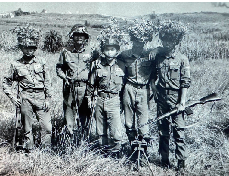
官校二年級野外訓練課程

家中以務農為主，並兼在市場擺攤販售豬肉，兄弟姊妹共十位，我排行第七。小學就讀田寮國小，在鄉村成長有牽牛吃草、甚或騎在牛背上的樂趣！放假時會幫忙下田除草、挑秧、曬收稻穀等工作。小時候的娛樂主要是打彈珠、抓蜻蜓，或到河邊玩水、抓青蛙、網魚等田野遊戲，童年回憶迄今印象深刻。