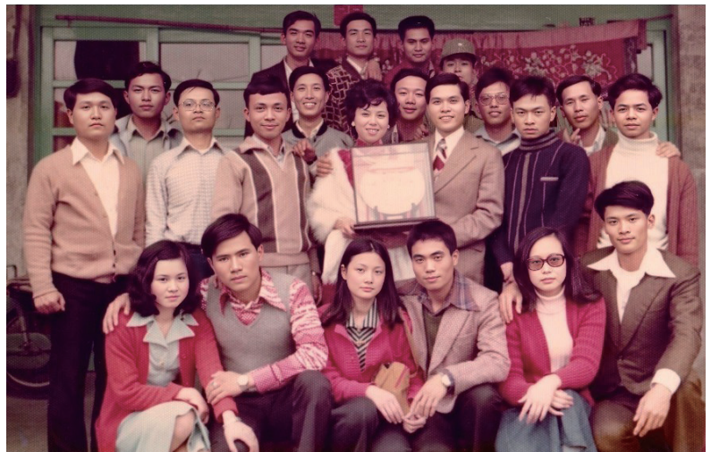
44期裝甲兵同學中率先結婚，獲冠軍獎牌

我畢業被派到戰車712營第3連任排長，任務繁忙，要想將職務做得好，唯有與心中唯一愛