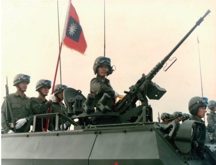
1986年率領裝甲步兵營參加國慶閱兵

優秀的愛情顧問，幾年下來績效甚佳，獲得阿香好感，最後得以修成正果。她做事認真且精緻，不但對同學（事）很好，在光復中學工作表現優異！我們三、四年級時，她利用學校的旅遊或自己休假到官校探視我，認識了好一些甲兵同學。我在學校功課不佳，寒暑假參加過輔導課，假日也曾被禁足讀訓育專書，午後才能外出休假。