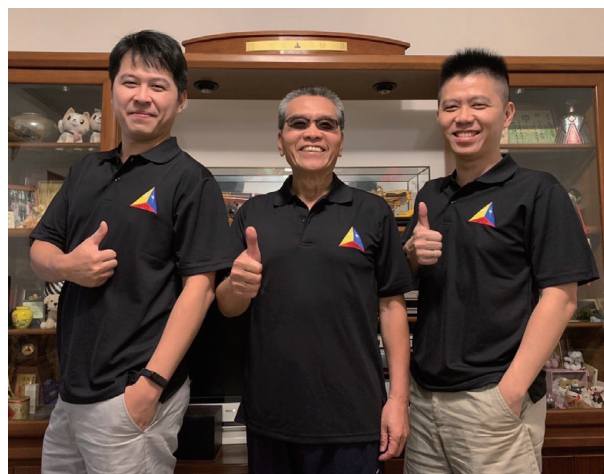
父子兄弟，一門三甲兵

如今退伍已23載，仍然保持運動、休閒、工作並重，在無壓力狀況下，依自己的興趣仍在永續向前行。未來更應把握時間回饋自己，在精彩愉悅的環境中保持靜心、平心、放下、知足的心態，過著屬於自己的平凡生活！