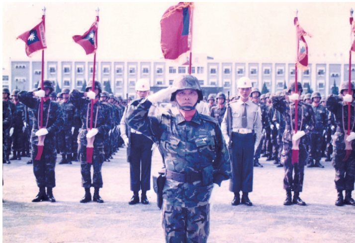
1999年裝甲51旅編成典禮，派任旅長

搞了四年到1987年，營長做完到裝校幹計劃科長。經過羅文山與胡家騏兩任指揮官的教導，1989年報考戰爭學院，成績是裝甲兵備取第一名！參謀總長郝伯村突然下令修正戰院不分兵科、而改以成績比序大排名方式錄取，運氣真好。哈哈！我變成裝甲兵最後一名闖入戰院！