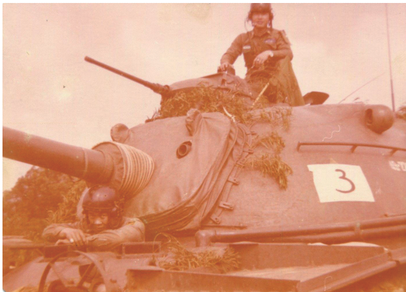
戰車連長乘座指揮車出擊

目前兒女都已長大結婚，並為我們家族增加了二位外孫、一位內孫，組織美滿的家庭。我們家庭常有團聚，共享天倫之樂，這就是我一生最大的幸福。