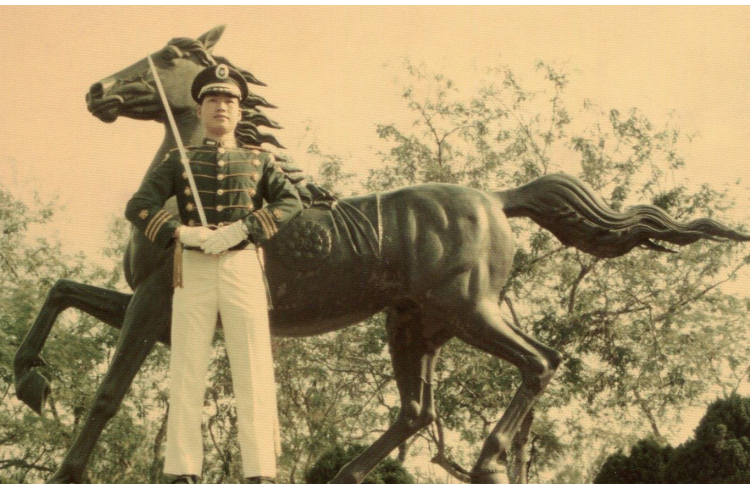
年輕帥氣的官校學生