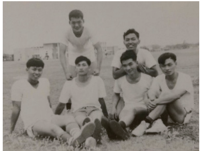
上體育課和同學踢完足球休息

果芸赴美就任後，想拜訪美國國防部爭取軍售，但因中共阻撓，不得其門而入。但果芸並不氣餒，改採和美國軍品公司合作，由他們提供各種武器系統、零組件等資料，然後由我方自行研發生產。陸軍的M48-5H戰車、空軍的IDF戰機、海軍的PFG-II巡防艦等，就是他們努力的成果。