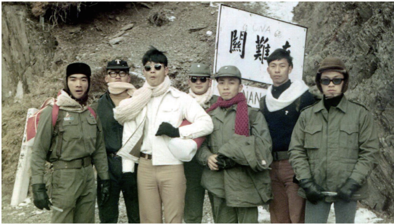
三年級寒假與同學登合歡山