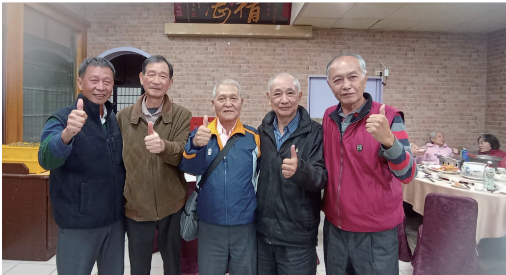
龍潭虎聚，友誼長存

能在學校上班，工作時間固定，上班地點離家近，薪水比照公立學校師院畢業教師敘薪，每