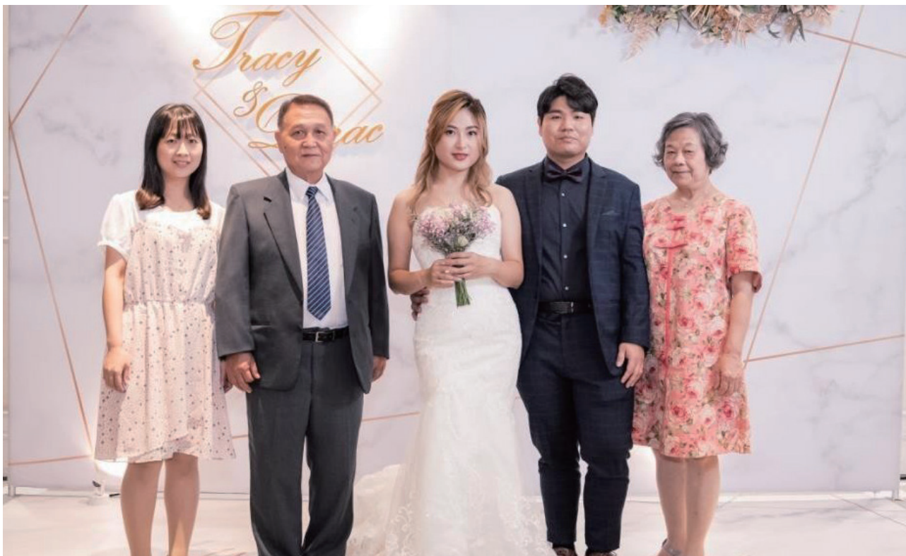
長子結婚全家合照

比得到全國第一名。1983年4月帶領一個戰車連赴澎湖參加漢光五號演習，演習項目是展示M48戰車砲的火力。演習當天，在接獲射擊命令後，10輛戰車同時向海中射擊，沒有標靶、也不用瞄準，隨著砲彈射出煙霧瀰漫、砲聲隆隆，卻只是一場沒有觀眾的煙火秀。每車8發砲彈，短短6到8分鐘射擊完畢，戰車連的演習任務達成。1983年8月調731營副營長，1985年調後勤科科長，1986年晉升中校，1987年1月調支援營營長，1989年2月調裝甲兵學校指揮參謀組教官。