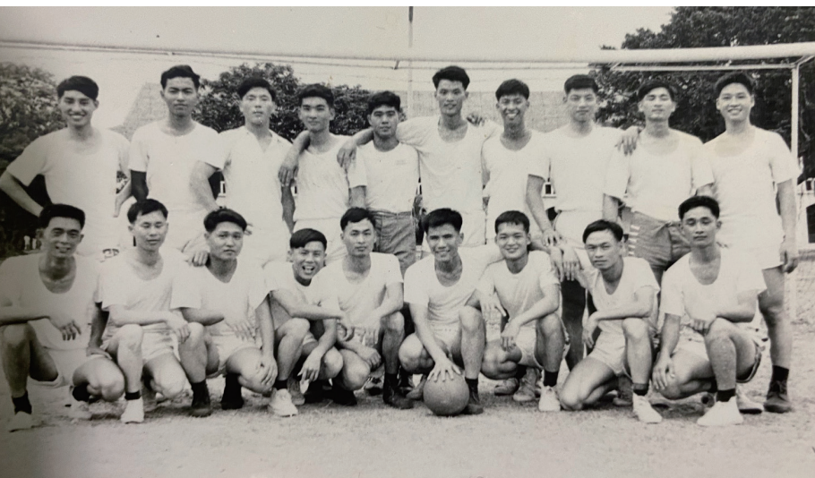
學生時期在足球場上和同學合影